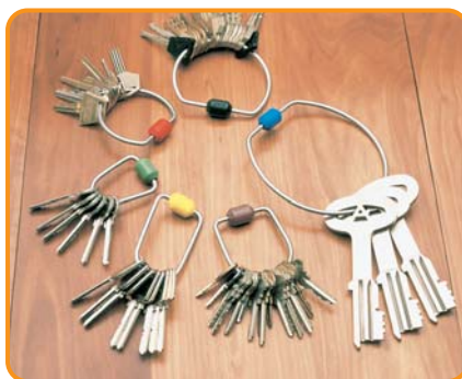
6 tamaños distintos