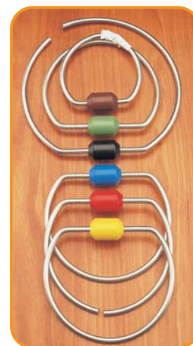
6 colores distintos